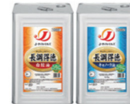
2007 業務用長持ち油「長調得徳」(現在の「長徳」)発売