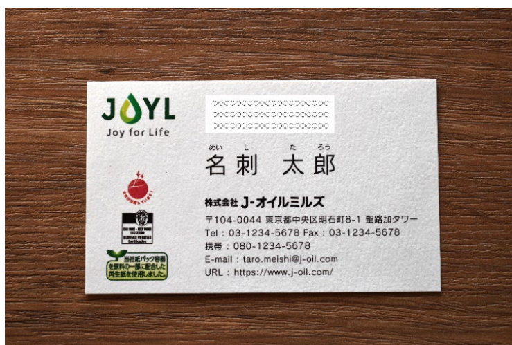
「スマートグリーンパック®」の廃紙パックを配合した名刺

今回、さらなる環境負荷低減への取り組みとして、当社工場で発生する廃紙パックの一部を再資源化し、当社の名刺として活用します。廃紙パックを配合した再生紙の名刺にはオリジナルのリサイクルロゴを掲載し、環境負荷低減に向けた活動の認知拡大を目指します。