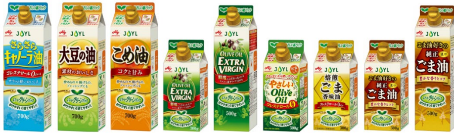
「スマートグリーンパック®」シリーズ

「スマートグリーンパック®」シリーズは、プラスチック廃棄物や CO 2 排出量の削減を推し進めるため、油脂製品では珍しい紙パック（森林認証紙）を容器に採用し、包装機能と環境対応を追求したシリーズです。2021 年 8 月に 2 製品を販売開始後、2022 年春にシリーズ化、その後もラインナップの充実を図っています。