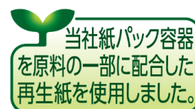
オリジナルのリサイクルロゴ

当社はこれからも資源利用効率の最大化に努め、環境負荷低減の取り組みを推進してまいります。